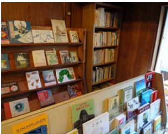
こどもまち図書館の書棚

本と子どもをつなぎたいという思いから、2009 年に四日市市松本の古民家をお借りしてスタートしました。開館は、毎週土曜日 11 時～16 時としており、子どもは