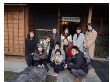
こどものまち図書館玄関前

行政や補助金に頼らず、「自分たちでやろう」を基本としています。今後もチルドレンズミュージアムの常設をめざし、「こどものまち図書館」では、本と子どもをつなぐ、よりよい居場所となるように活動していきたいと思えます。